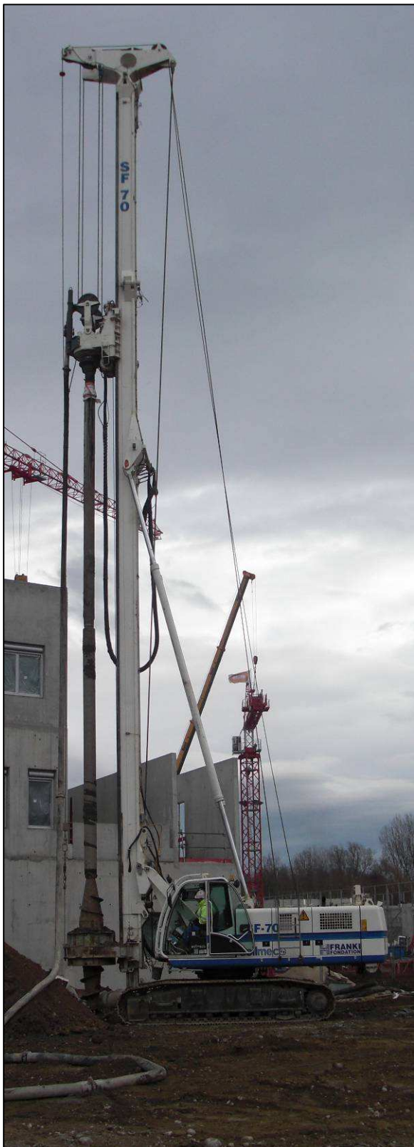
Réalisation des pieux de l'extension de soins