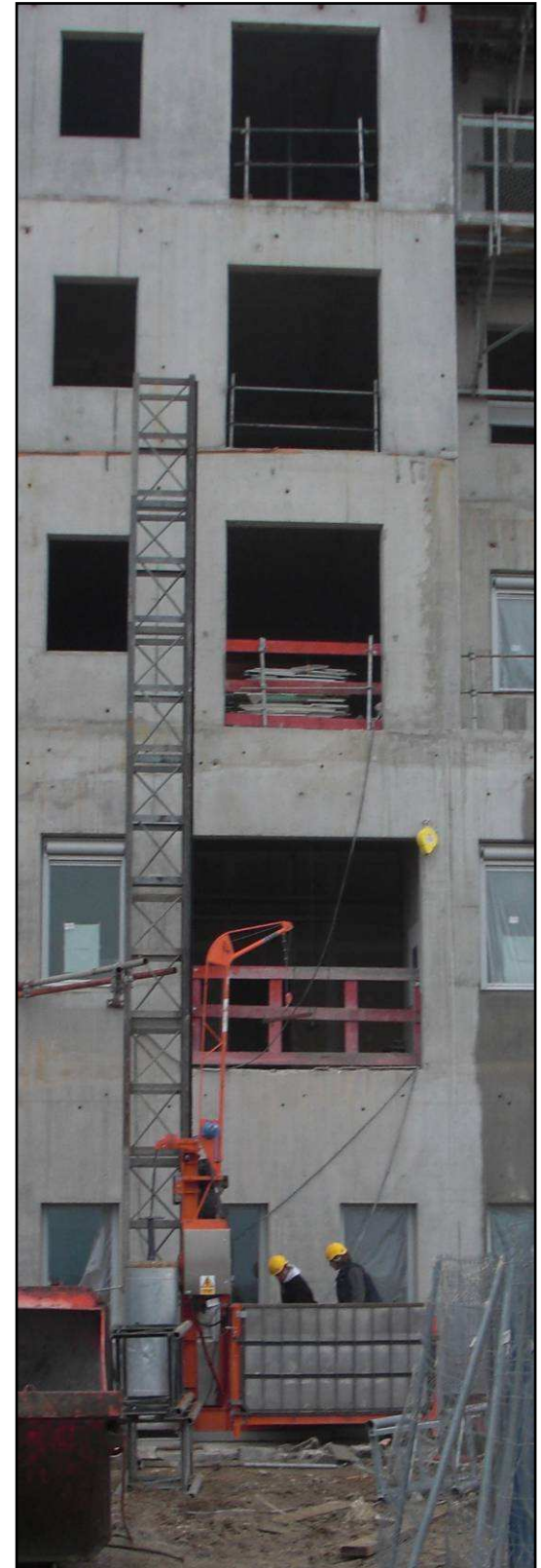
Montage du lift de chantier

> Retrouver toutes les news/photos du chantier sur le site :