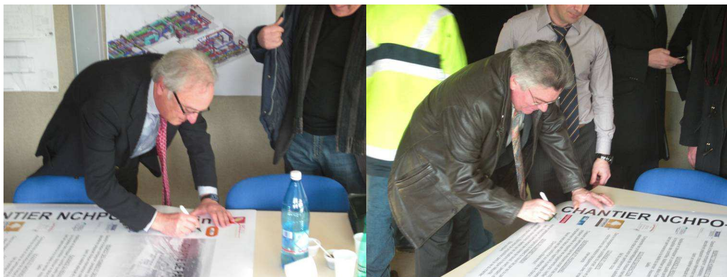
Le CODIR s'est achevé par la signature de la charte de partenariat.

Les enjeux 2009 du projet seront la maîtrise de l'activité, du planning, de la sécurité, de la qualité, de l'environnement, des coûts