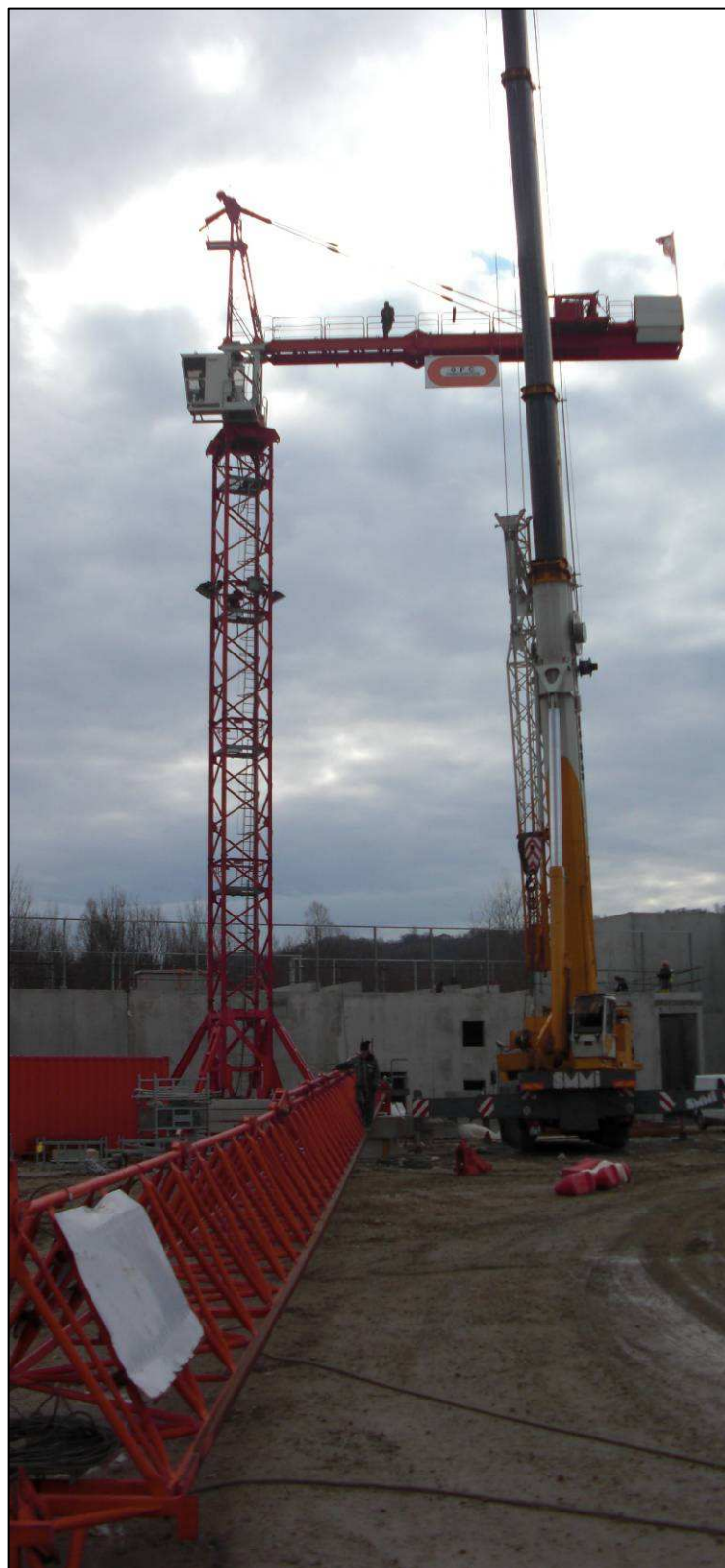
Démontage grues G1/G4/G7 Montage grue G8